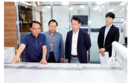
동화동 의류패션지원센터 방문