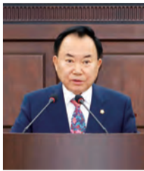
소재권 책임검사 위원

12일 열린 제1차 본회의에서는 2023 회계연도 결산검사 결과보고와 예산결산특별위원회 구성 결의안 및 선임의 건 등이 처리되었다.