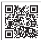
수상자 발표 바로 보기