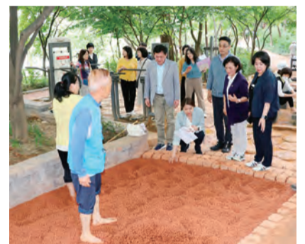
응봉근린공원 황톳길 현장을 점검