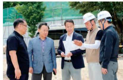
금호여자중학교 신축 현장 점검