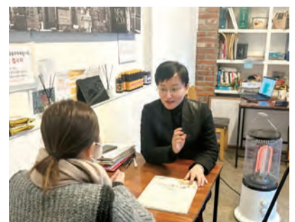
약수역 일대 도심공공주택복합사업 관련 현장지원센터

의견을 제시할 수 있게 만들어 투명하고 공정하게 사업을 바라 볼 수 있게 해줘서 정말 든든했습니다. 주민들의 알권리를 확실하게 보장했던 점에서도 저희 구는 남달랐습니다. 깜깜이 행정 지원이 아니라, 솔직하게 사업의 장단점을 확실하게 짚어 주니, 주민들이 구청에서 진행하는 모든 일들을 신뢰하게 되었습니다. 또한 궁금한 점이 있으면 적극적으로 나서서 알아 봐 주시고, 어떻게 하면 되는지까지 상세하게 방향을 알려 주셔서 사업추진이 다른 곳보다 빠른 편입니다. 저는 이런 중구를 믿고 앞으로도 열심히 일할 생각입니다.