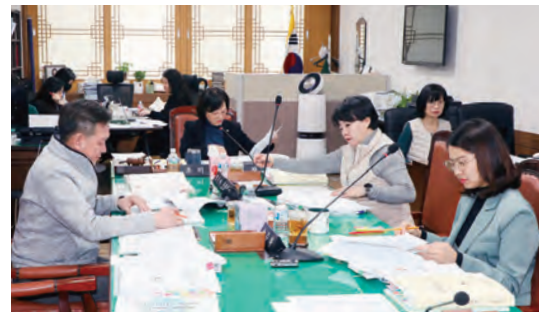
▲(위에서부터) 의회운영, 행정보건, 복지건설 위원회에서 업무보고를 받고 있다.