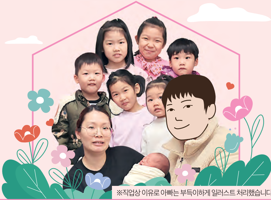
※직업상 이유로 아빠는 부득이하게 일러스트 처리했습니다.

지난 2월 5일 우리 중구에 큰 경사가 있었습니다. 청구동에 거주하는 95년생 동갑내기 부부에게서 7번째 아이가 태어났는데요. 이 소식은 검색포털 메인을 장식하기도 했습니다. 많은 분들이 함께 기뻐해 주셨고, 한 기업은 구청을 통해 이 가족에게 1억원을 후원하기도 했습니다. 후원금은 9명의 가족이 지금보다 쾌적한 보금자리를 마련하는 데 쓰일 예정입니다. 중구에서도 전세 임대제도 등을 통해 보금금 마련 방법을 안내하고 공인중개사와 연계해 새집을 구하기까지 적극적으로 지원하고 있습니다. 부부는 많은 분들의 관심에 감사사를 표하며 중구에서 계속 살고 싶다는 말을 전했습니다. 저출생이 사회적 문제로 부각되고 있는 요즘, 7번째 아이의 탄생은 우리 모두가 축복해야 할 일입니다. 중구민 모두가 한마음으로 축하해 주시길 바랍니다. 중구는 우리 아이들이 행복한 미소를 머금고 살아갈 수 있도록 아이 키우기 좋은 환경 만들기에 최선을 다하겠습니다.